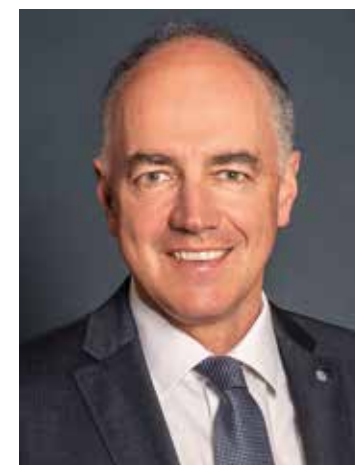
CHRISTOPHE DARBELLAY Chef du Département de l'économie et de la formation

La formation professionnelle est bien plus qu'un simple parcours académique ou pratique. Elle est un pilier essentiel pour construire un futur où chacun peut développer ses talents, trouver sa voie et contribuer à la vie de la société. Elle offre des chances concrètes de transformer les aspirations en réussites, tout en répondant aux besoins de l'économie.